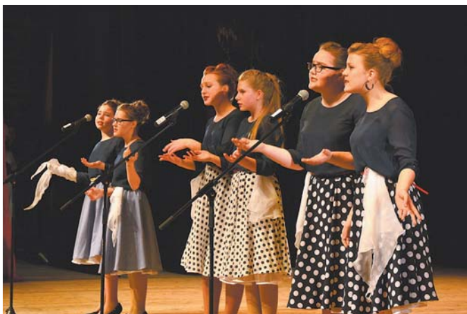
«Сегодня праздник у девчат», – пели участницы вокального ансамбля «Звуки музыки» из лицея № 378. 3 место – за полный юмора и хорошего настроения номер