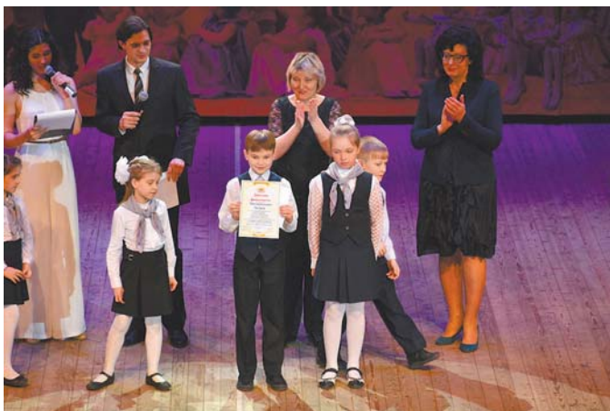
Диплом финалистов фестиваля для участников ансамбля «Радуга» из школы № 392