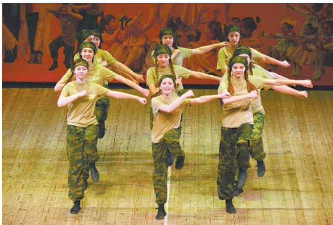
Веселый танцевальный номер «Солдаты» настолько понравился жюри и зрителям, что они единодушно присудили ансамблю «Снежана» (ПМК «Нарвская застава») Гран-при в хореографической номинации

3 место – вокальный ансамбль «До, Ре, Ми», шко