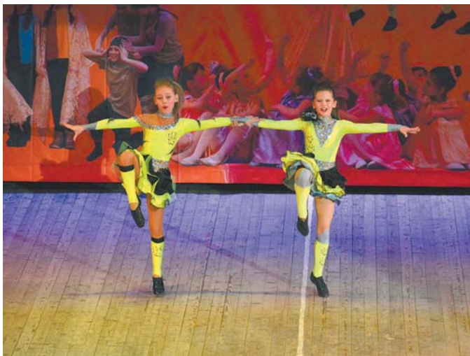
Рок`н`Ролл жив! Это доказали солистки танцевального коллектива «Смена» (ПМК «Смена»), которым зажигательный танец принес 1 место на фестивале