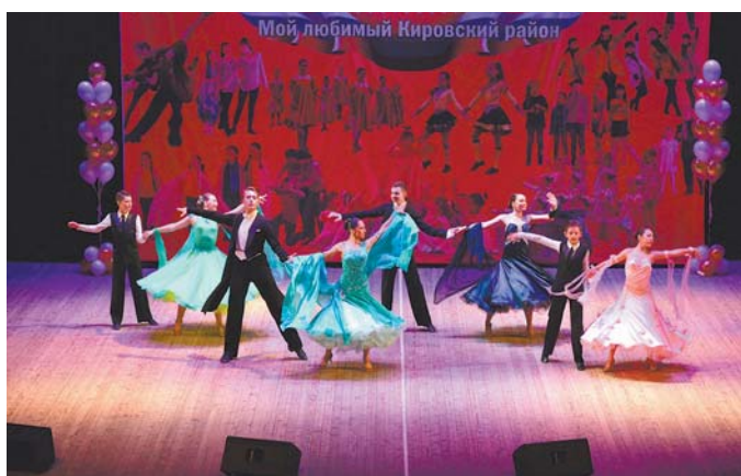
В вихре элегантного вальса закружились участники танцевального клуба «Драйв» (школа № 254) – обладатели 3 места хореографической номинации