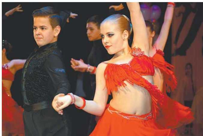
Темпераментное исполнение «Ча-ча-ча» принесло танцорам из студии бального танца «Онда» (ПМК «Прометей») заслуженное 2 место в хореографической номинации